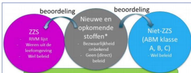
Figuur 2 Schematische weergave verband tussen ZYS en nieuwe en opkomende stoffen