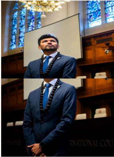
Van campagne naar het Vredespaleis