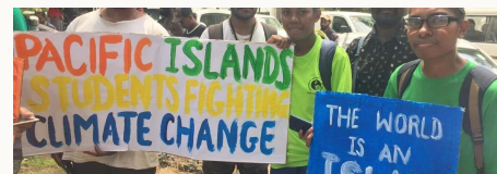
"The world is an island"