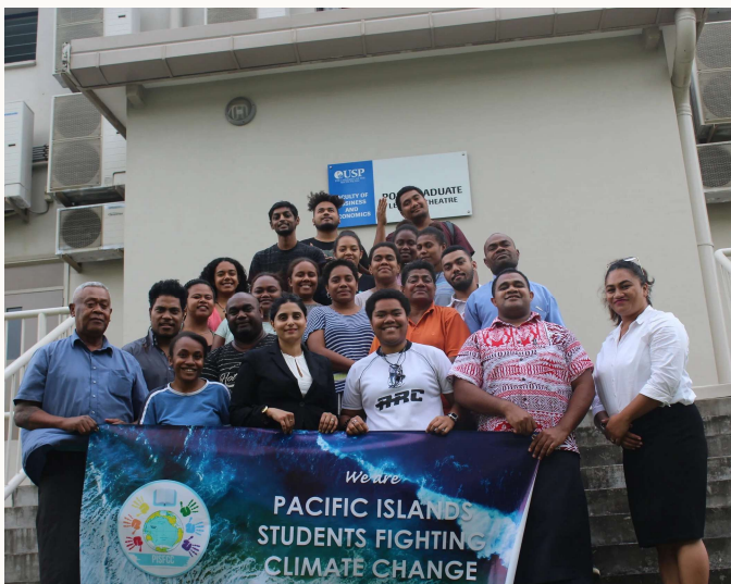
Pacific Islands Students Fighting Climate Change

Van de collegebanken in Vanuatu - via New York - naar het Vredespaleis in Den Haag